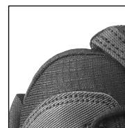
HAIX® Climate System