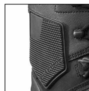
HAIX® Ankle Protector